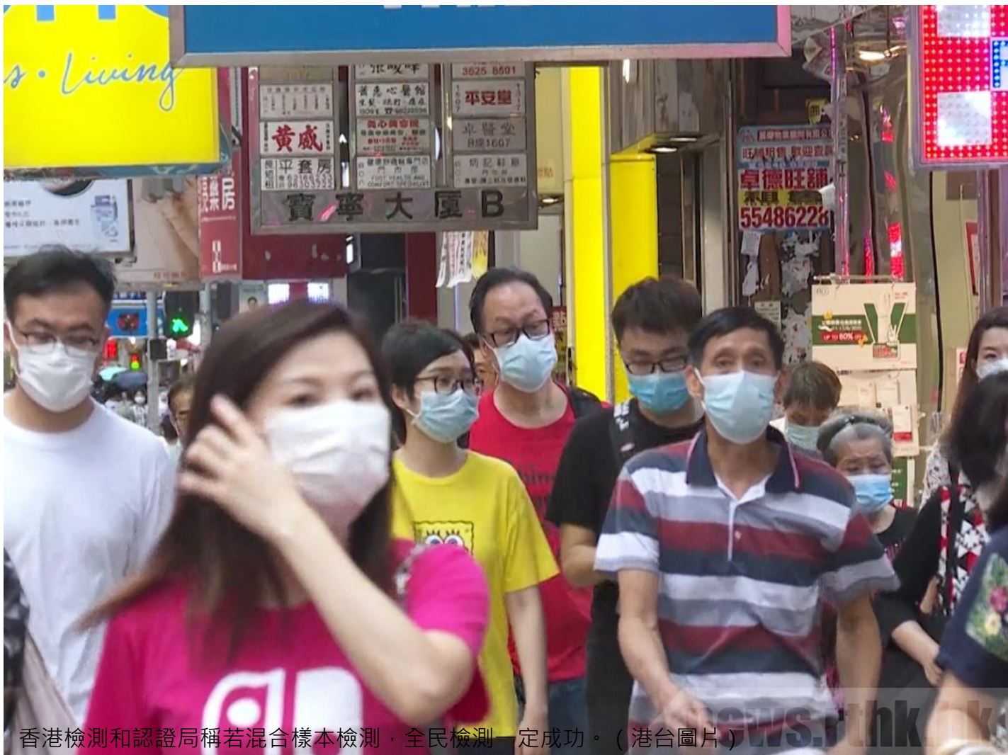
香港檢測和認證局稱若混合樣本檢測，全民檢測一定成功。

%A8%E6%B0%91%E6%AA%A2%E6%B8%AC%E4%B8%80%E5%AE%9A%E6%88%90%E5%8A%9F)